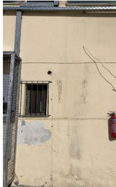
Εικόνα 3: Διαθέσιμος χώρος για εγκατάσταση αντιστροφέα

Δεδομένου ότι η συνολική ισχύς του Φ/Β συστήματος μετά την επαύξηση υπερβαίνει τα 55 kWp απαιτείται η εγκατάσταση κιβωτίου δοκιμών. Το κιβώτιο δοκιμών θα πρέπει να είναι τριών (3) φάσεων, τεσσάρων (4) αγωγών, σύμφωνα με την Τεχνική Προδιαγραφή ΔΕΗ Α.Ε. GR-107/Αναθεώρηση 7ος/1964 και με δυνατότητα σφράγισης από το ΔΕΔΔΗΕ.