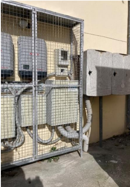
Εικόνα 2: Εξοπλισμός υφιστάμενου Φ/Β σταθμού

Επίσης θα εγκατασταθούν στην άφιξη της παροχής μετασχηματιστές έντασης (σε συνεννόηση με τον ΔΕΔΔΗΕ) για την μέτρηση της παραγόμενης ενέργειας.