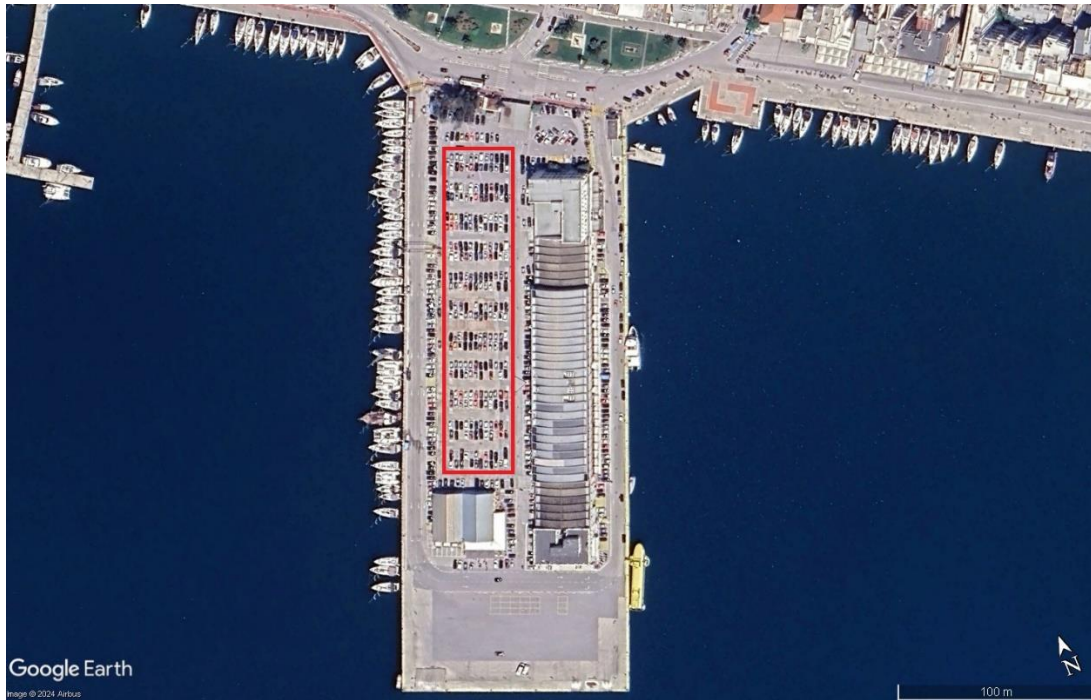
Εικόνα 5: Διαθέσιμες θέσεις χωροθέτησης του Φ/Β συστήματος

Η εγκατάσταση του Φ/Β σταθμού θα γίνει στον υπαίθριο χώρο στάθμευσης του Κεντρικού Προβλήτα, αρμοδιότητας Ο.Λ.Β. Α.Ε., όπως αποτυπώνεται στην ακόλουθη εικόνα.