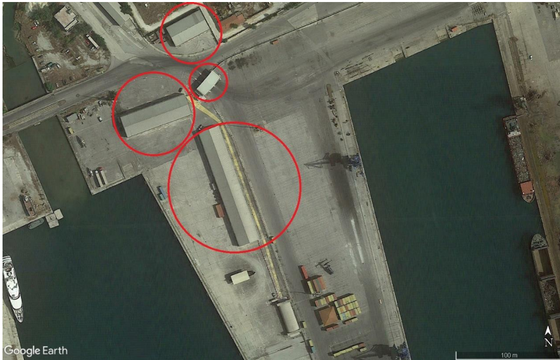
Εικόνα 4: Διαθέσιμες στέγες χωροθέτησης του Φ/Β συστήματος

Σε ότι αφορά τους αντιστροφείς αυτοί θα πρέπει να είναι της ίδιας σειράς και μοντέλου. Οι αντιστροφείς θα εγκατασταθούν σε εξωτερικό χώρο.