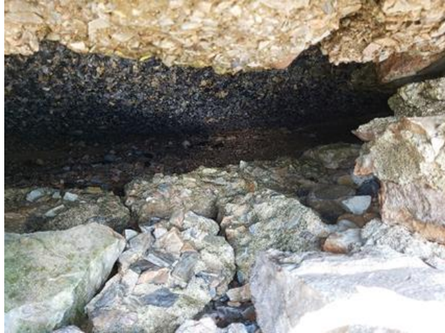
ΕΙΚΟΝΑ 5 Α